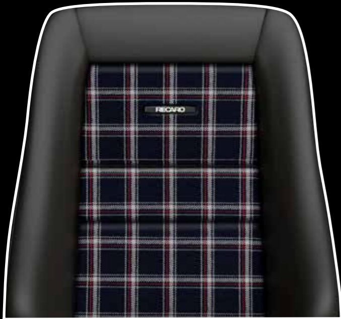
Leder schwarz/Stoff Karo