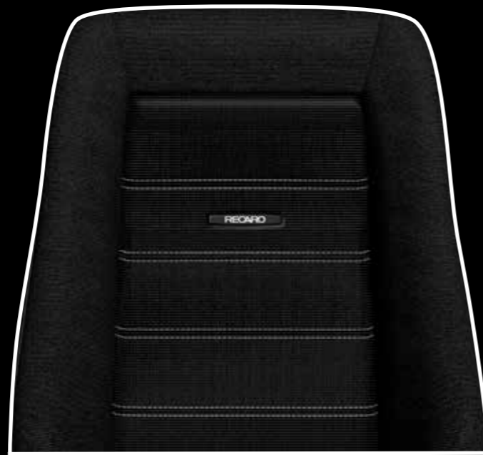
Leder schwarz/Würfelfcord schwarz