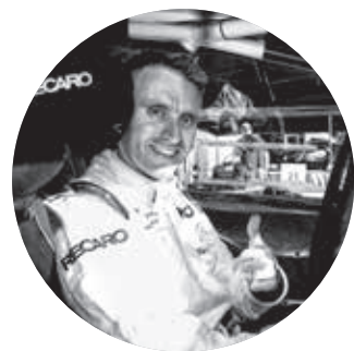
Timo Bernhard Gesamtsieger 24 h Le Mans 2017 FIA-LMP1-Langstreckenweltmeister

„Der RECARO Sitz gibt mir im Rennauto nicht nur die nötige Sicherheit, sondern auch einen gewissen