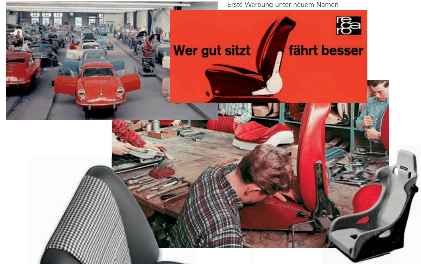
Erste Werbung unter neuem Namen

Wussten Sie, dass 1950 im Reutter-Werk I der erste Porsche-Sportwagen „Typ 356“ (Karosserie und komplette Innenausstattung) gebaut wurde? Das Karosseriewerk mit dem zweiten Standort in Stuttgart-Zuffenhausen verkaufte Reutter 1963 an Porsche und konzentrierte sich fortan unter dem Namen RECARO auf die Kernkompetenz Sitz.