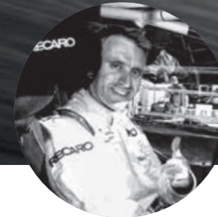
Timo Bernhard Profi-Rennfahrer

„Der RECARO Sitz gibt mir im Rennauto nicht nur die nötige Sicherheit, sondern auch einen gewissen