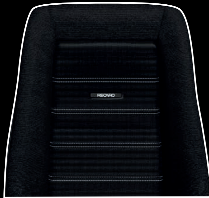
Leder schwarz/Würfelfcord schwarz