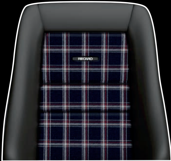
Leder schwarz/Stoff Karo