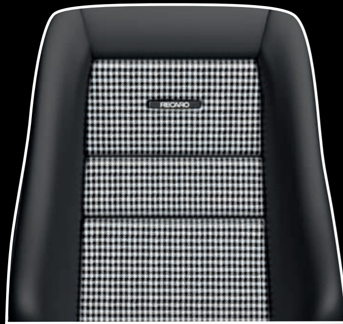
Leder schwarz/Stoff Pepita